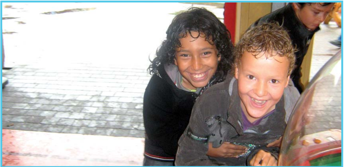
Jonge mantelzorgers in Walibi

In de zomervakantie is er voor de jongste deelnemers een uitje georganiseerd naar de Linnaeushof en de oudsten gingen naar Walibi om zo alle jonge mantelzorgers een leuke vakantiedag te bezorgen en hen even te ontlasten van hun zorg.