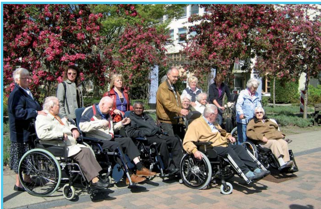
10 jaar Wandelgroep Vrijwillige Thuishulp

Tevens biedt de Vrijwillige Thuishulp wandelprojecten voor rolstoelafhankelijke bewoners in de zorgcentra De Kiekendief, Archipel en De Overloop. In De Overloop is dit jaar een tweede wandelgroep gestart. In april 2010 is het 10-jarig bestaan gevierd van de wandelgroepen. De eerste wandelgroep is in april 2000 in De Kiekendief gestart. De wandelgroepen bestaan uit 48 vrijwilligers.