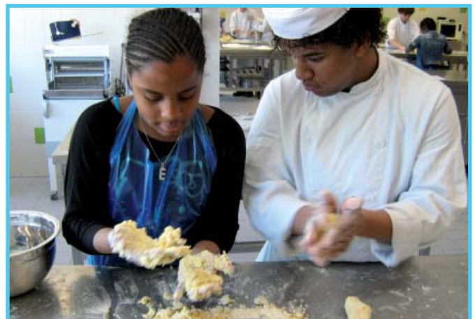
Leerlingen Echnaton koken met jonge mantelzorgers