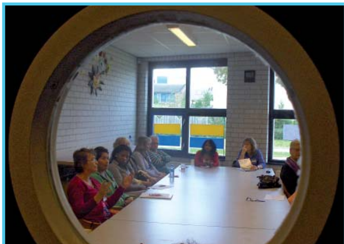
Kennisdag VMCA vrijwilligers 16 oktober 2010

In 2010 is voor het eerst een kennisdag georganiseerd waarvoor alle vrijwilligers van de VMCA zijn uitgenodigd. Tijdens deze kennisdag zijn drie workshops elk drie maal aangeboden aan de vrijwilligers. De workshops, met de thema's: Werken vanuit je kracht, Interculturele communicatie en Gesprekstechnieken zijn door ruim 80 vrijwilligers gevolgd. Omdat het een groot succes was, zal een kennisdag voor vrijwilligers deel uit blijven maken van het programma van deskundigheidsbevordering van de VMCA.