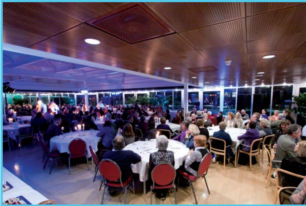
Helden om de Hoek, diner bij de gemeente Almere