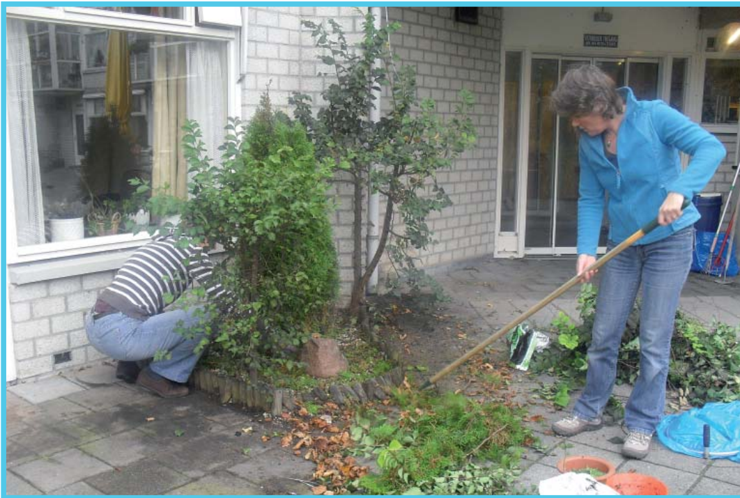
Medewerkers VMCA aan de slag bij De Overloop

In het kader van teambuilding en als voorbeeld voor maatschappelijk ondernemen, hebben de medewerkers zich een dag vrijwillig ingezet voor zorgcentrum De Overloop. Een groep ging met rolstoelafhankelijke bewoners naar de markt, er is een muurschildering gemaakt, de tuin is onder handen genomen en er is geholpen in de keuken.