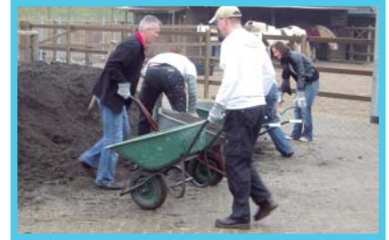
Medewerkers van de Kamer van Koophandel tijdens NL Doet aan de slag op Manage De Stek

Binnen FreeFlex is het aantal bemiddelingen van vrijwilligers die reageren op kortdurende vrijwilligersklussen fors toegenomen. Deze stijging is vooral het gevolg van de toename van het aantal bedrijven die gebruik maken van de diensten van FreeFlex om, in het kader van Maatschappelijk Betrokken Ondernemen, te zoeken naar kortdurende vrijwilligersklussen bij maatschappelijke organisaties.