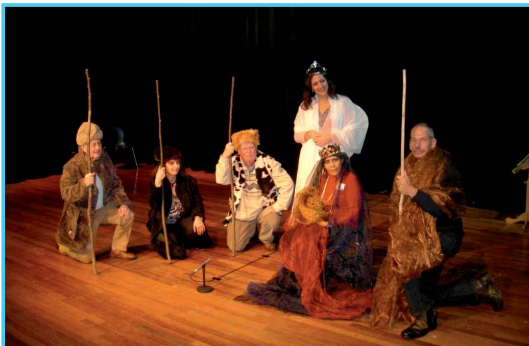
Kerststal door vrijwilligers en medewerkers VMCA in de schouwburg

In december is er speciaal voor de vrijwilligers van de Terminale Zorg een interactieve kerstvoorstelling met diner georganiseerd in de Schouwburg Almere. Dit is mogelijk gemaakt door het fonds NutsOhra. Ook de vrijwilligers van de Intensieve Vrijwillige Thuishulp en Vriendschap op Maat zijn hiervoor uitgenodigd.